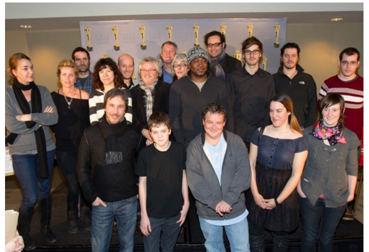
Les finalistes présents lors de la conférence de presse.