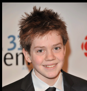
Robert Naylor, en nomination pour Premier rôle masculin pour 10 1/2