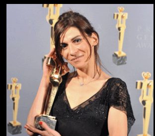
Lubna Azabal, récipiendaire dans la catégorie Interprétation féminine dans un premier rôle