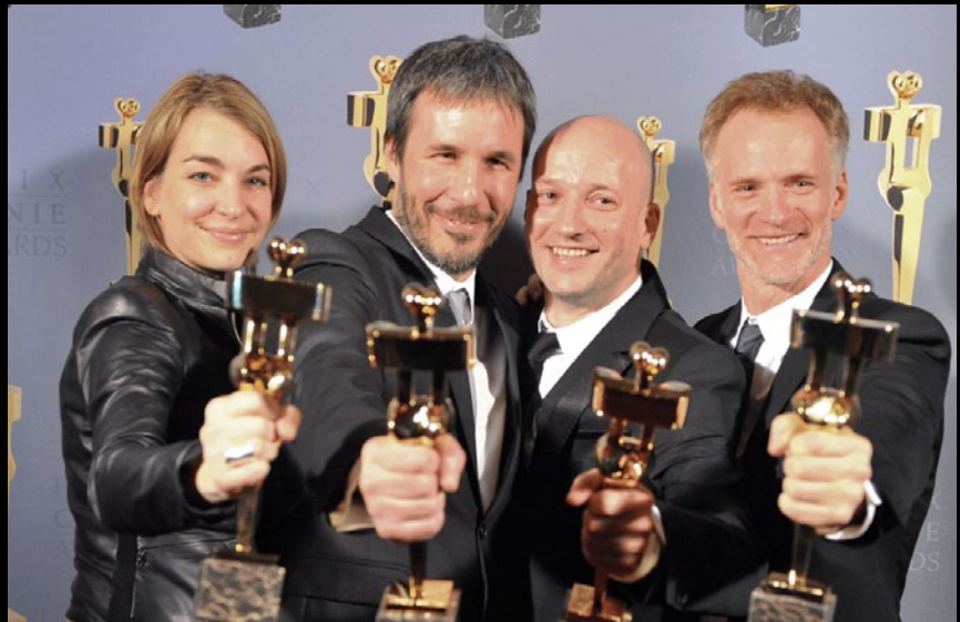
Denis Villeneuve et son équipe